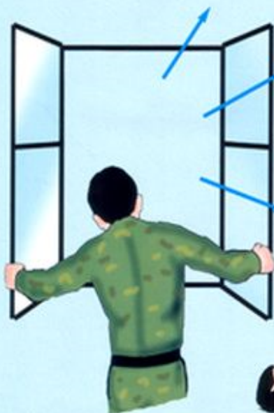
Обеспечение притока свежего воздуха

В случае потери сознания и при наличии пульса на сонной артерии повернуть пострадавшего на живот, приложить к голове холод, вызвать скорую помощь