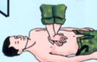
Непрямой массаж сердца