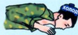
Прикладывание холода к голове