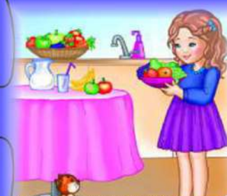
МОЙ ФРУКТЫ ПЕРЕД ЕДОЙ