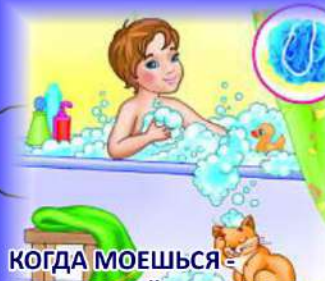
КОГДА МОЕШЬСЯ - НЕ ЗАБЫВАЙ ПРО МАЧАЛКУ