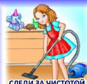
СЛЕДИ ЗА ЧИСТОТОЙ СВОЕЙ КОМНАТЫ