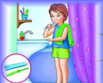
ЧИСТИ ЗУБЫ 2 РАЗА В ДЕНЬ

Чтобы быть всегда здоровым, очень бодрым и весёлым, день с зарядки начинай, гигиену соблюдай!