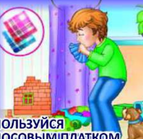
ПОЛЬЗУЙСЯ НОСОВЫМИ ПЛАТКОМ ПРИ ЧИХАНИИ И КАШЛЕ